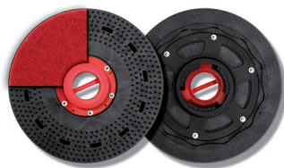
Plateau Padloc support disque Ø406mm réf.606401 (option P)

(Photos et données techniques non contractuelles et modifiables sans préavis.)